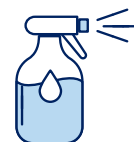
Je mouille mon corps