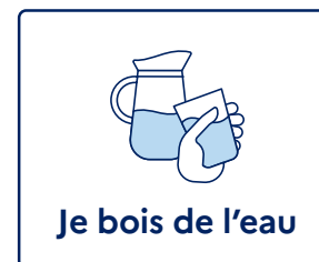
Je bois de l'eau