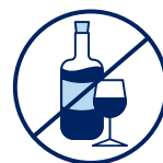
J'évite de boire de l'alcool