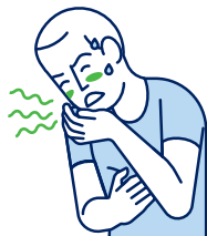
Vertiges / Nausées