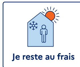
Je reste au frais