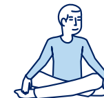
Je fais des activités sans effort